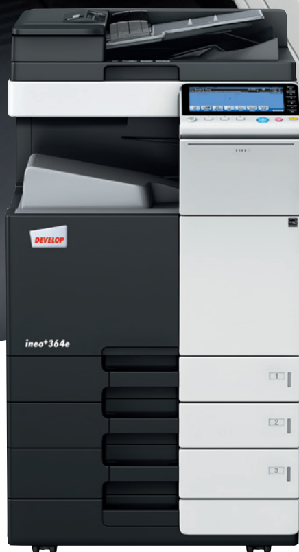
ineo+ 364e z podajnikiem papieru (PC-210) i podajnikiem oryginałów (DF-701)