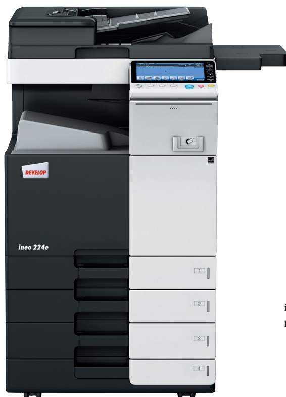
ineo 224e z podajnikiem oryginałów (DF-701), podajnikiem papieru (PC-210) i półką boczną (WT-506)

Każde z tych wielofunkcyjnych urządzeń – ineo 224e, ineo 284e, ineo 364e, ineo 454e oraz ineo 554e – jest nie tylko wyjątkowo proste w obsłudze, lecz również oferuje szeroką gamę funkcji ułatwiających wykonywanie codziennych prac biurowych. Oszczędzając czas na drukowaniu, kopiowaniu lub skanowaniu, użytkownik może szybciej zająć się swoją właściwą pracą. A to znacznie podnosi wydajność.