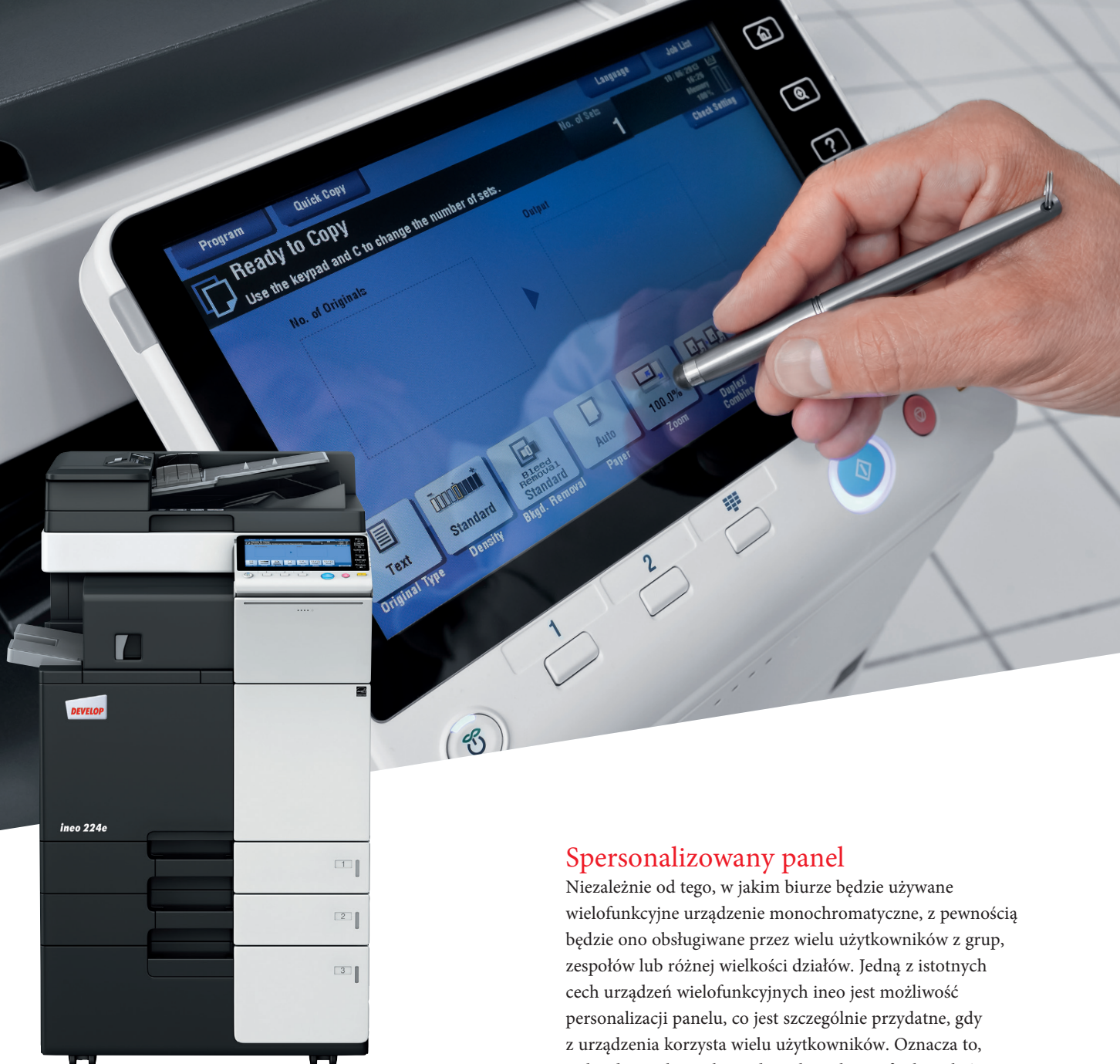
ineo 224e z podajnikiem dokumentów (DF-624), finiszerm wewnętrznym (FS-533) i kasetą dużej pojemności (PC-410)