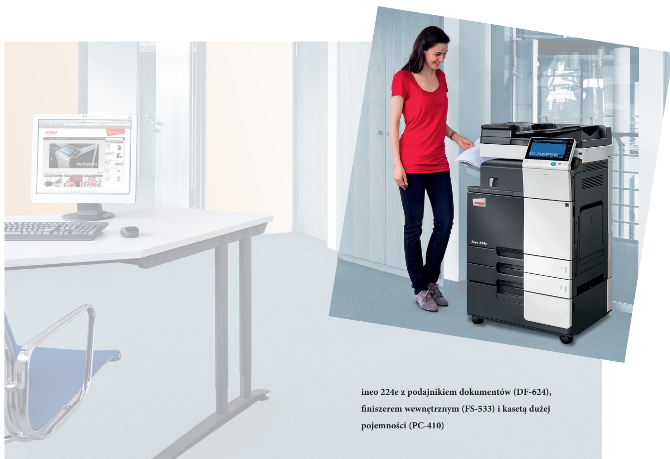
ineo 224e z podajnikiem dokumentów (DF-624), finiszerm wewnętrznym (FS-533) i kasetą dużej pojemności (PC-410)

Te monochromatyczne systemy wyposażone są w liczne energooszczędne rozwiązania, które zmniejszają zużycie energii o ponad 40% w porównaniu do poprzednich modeli. Podczas gdy oszczędzają one pieniądze, inne ekologiczne rozwiązania są korzystne dla środowiska. Oznacza to, że oferowane przez DEVELOP urządzenia serii ineo e są nie tylko korzystne dla środowiska, ale również podkreślają troskę użytkownika o środowisko naturalne.